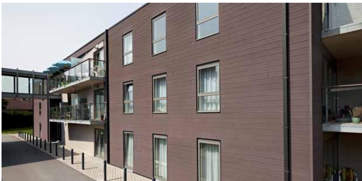
Réalisation avec système lisse